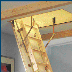
Půdní skládací schody